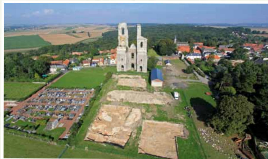
Vue générale du site de l'abbaye du Mont-Saint-Eloi

Connue en partie par des sources manuscrites et des plans anciens, l'histoire de ce site sera enrichie grâce aux vestiges mis au jour par l'archéologie, à l'occasion des fouilles.