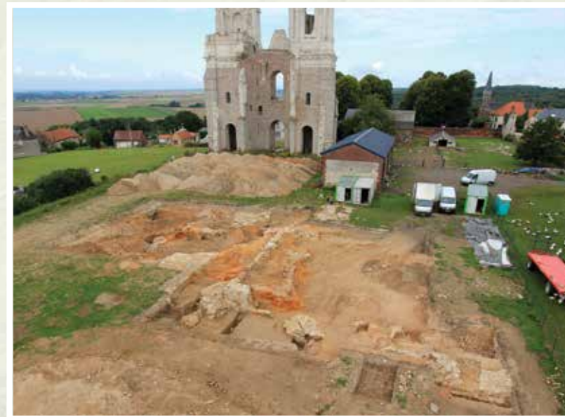
Vue aérienne du site de l'abbaye du Mont-Saint-Éloi

Propriétaire des deux tours de l'abbaye du Mont-Saint-Éloi depuis le 1 er janvier 2008, le Conseil général du Pas-de-Calais restaure et met en valeur le site. Dans ce but, il met en œuvre avec le soutien du Ministère de la Culture et de la Communication, une campagne de fouilles programmées de 2011 à 2013. Une équipe d'archéologues du Centre départemental d'Archéologie est intervenue d'août à septembre 2013 pour enrichir les connaissances concernant l'abbatiale gothique (XIII e siècle).