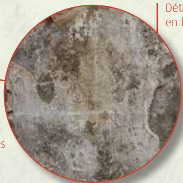
Détail des motifs en faux-appareil.

Les enduits ocres, décorés de motifs en faux-appareil blancs imitant les lignes d'une maçonnerie, recouvrent la pierre.