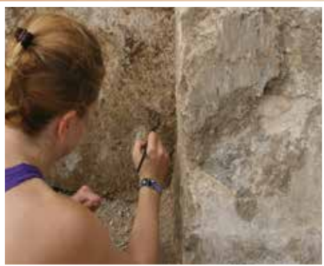
Puis, la restauratrice a procédé à un nettoyage délicat à sec, à l'aide d'un pinceau.

Une protection temporaire a d'abord été installée au-dessus des enduits en utilisant une bâche imperméable pour les protéger des agressions extérieures (vent, pluie, UV, etc.).