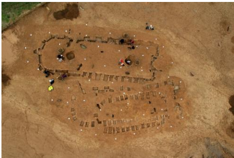
Vestiges archéologiques d'habitats néolithiques (Rebreuve-Ranchicourt)

L'exposition sera l'occasion de présenter un dispositif pédagogique de torchis à toucher.