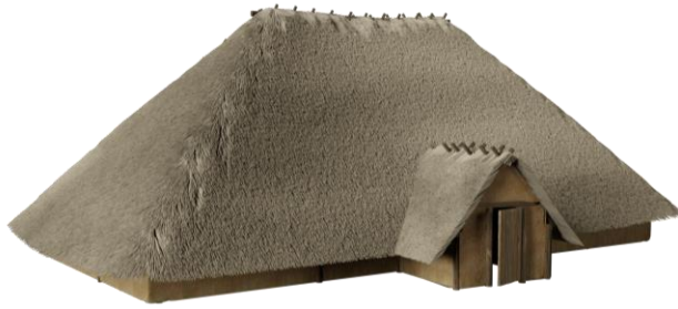
Restitution d'une maison allongée du 1 er Âge du Fer (Cuincy)

En guise de synthèse, une table de manipulation permet ici de replacer les formes de différentes maisons sur une chronologie.