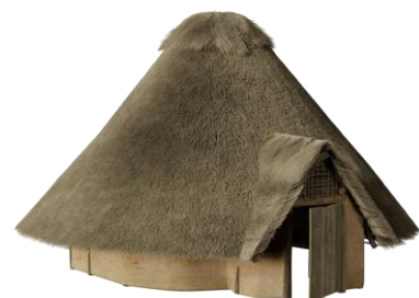
Restitution d'une maison circulaire de l'Âge du Bronze (Rebecaues)

L'exposition met en valeur une série de restitutions d'habitats aux différentes époques, issues des données archéologiques. Il n'existe évidemment pas d'images de cette lointaine époque. Les propositions de restitutions de bâtiments en 3D aident les archéologues à valider leurs interprétations.