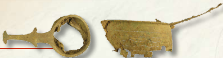
Passaires de bronze.

Après le départ des Romains, personne n'est venu s'installer. C'est seulement dans le courant des XVII e ou XVIII e siècles que de grands fossés à fond plat sont creusés. Ils devaient servir à drainer l'eau, afin d'assainir le sol et de permettre une mise en culture. Peut-être y cultivait-on déjà des pommes de terre !