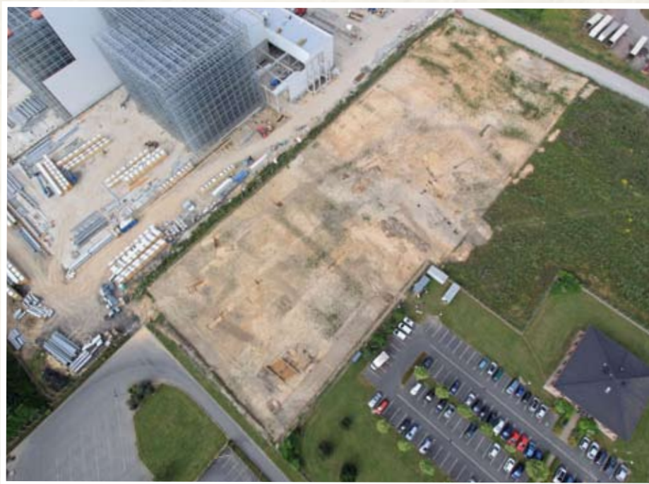
Vue aérienne du site en cours de fouille.

Le Département du Pas-de-Calais, sur la base des prescriptions de l'Etat, a réalisé des fouilles archéologiques pour la société Mc Cain dans le cadre de l'extension de son usine. Une dizaine d'archéologues du Service départemental d'Archéologie est intervenue de mai à août 2009 pour fouiller des vestiges des périodes protohistorique, romaine et moderne.